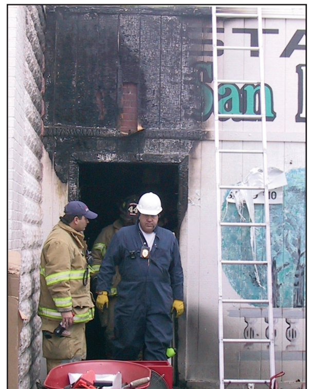
Los bomberos salen de la Taquería y Tienda San Marcos después de un incendio el viernes pasado en Goshen. Los bomberos no están seguros qué causó el incendio pero lo están investigando.